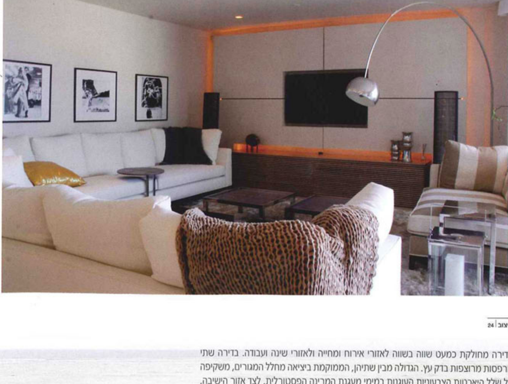
עיצוב | 24

אחד האתגרים העיצוביים העיקריים בדירה, המשתרעת על פני 200 מ"ר, היה השגת אותו מראה אסתטי, מסודר ואחד ושלונו בחומריות ובמרקם בתי חם. לצורך כך הותאמו פתרונות עיצוביים המסווים את צידה הסכני והפונקציונלי של הדירה ומקנים לה תחושה ביתית מממנה. עם זאת, התכנון והעיצוב מאפשרים לדירה ללווה לשנות במהירות את אופייה ולהפוך לדירת אירוח מרתקת ומועצבת למשעי, המשלבת בתוכה את מיטב הסכנוולוגיות והחומרים.