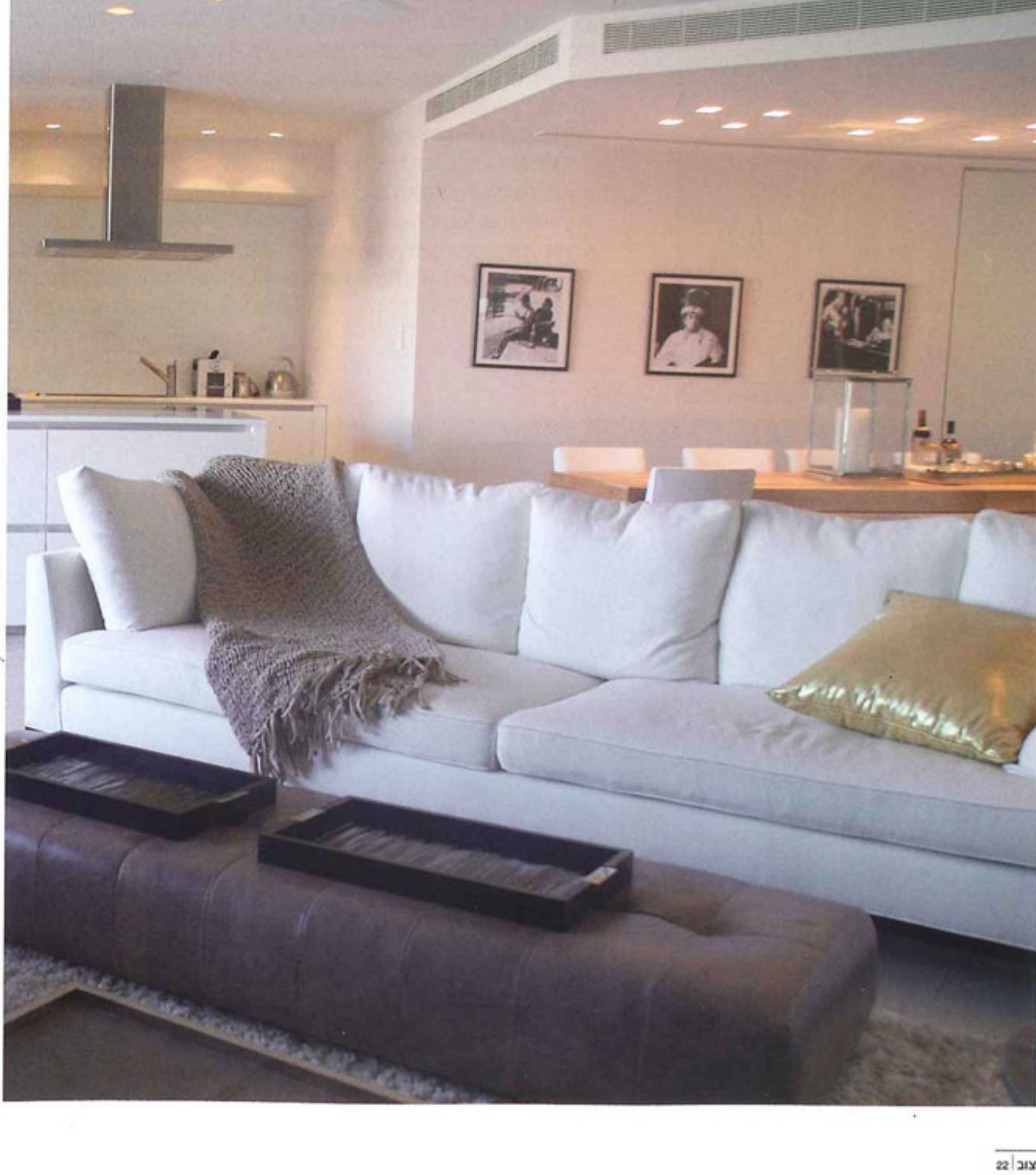
עיצוב | 22

במרינה של הרצליה תוכננה דירה המציעה חללים בעיצוב עדכני, עם אלמנטים ים תיכוניים הממסגרים רצועות חוף יום כחול