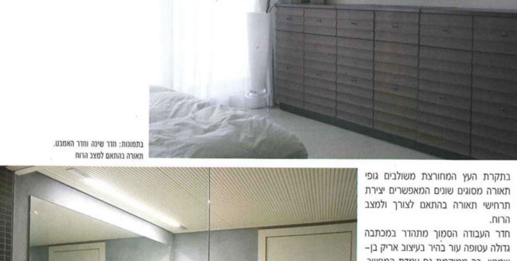
בתמונות: חדר שינה וחדר האמבטיה

מחדר השינה הראשי משקיפים שני חלונות גדולים אל חופיה הרדומים של הרצליה. החלל מרווח וכולל פינת ישיבה עם כורסאות ומש מרופדות. גם כאן, מרחף קיר נוסף בו שקוע מסך הפלזמה ומתחתיי שידת עץ האלון המוארכת. חדר האמבטיה הסמוך עוצב בגוונים של אפור ושחור. שחורים והמקשה ניצב קיר בגוון אפור גרפית המנותק מהקירות המקיפים אותו ומפיץ מדופנותיו הילה של אור לבן. בארון חדר הרחצה המרחף שוקע משטח קוריאן לבן בהק, בו משולב כיור זוויתי, בארון מגירות שחור מבריק בעיצוב מינימליסטי.