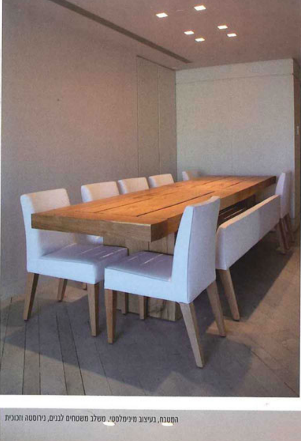
המטבח, בעיצוב מינימליסטי. משלב מסחסיים לבנים, נירוסטה וזכוכית